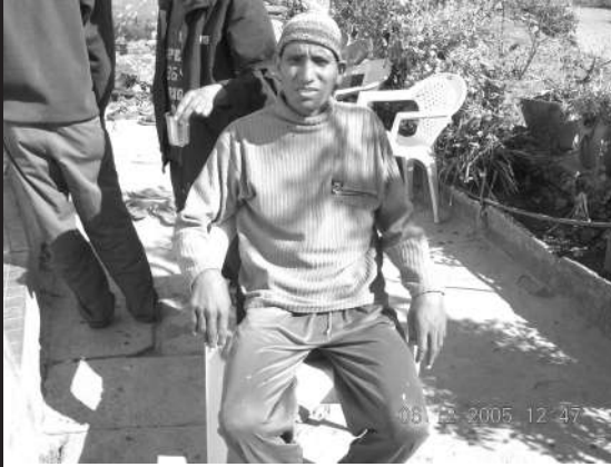
उपचार गर्न आउँदाको अवस्था