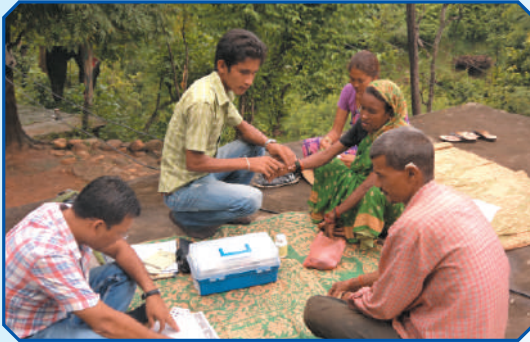
साथ साथ परियोजना अर्न्तगत समुदायमा तथा घरदैलोमा आधारित हेरचाहकर्ता संक्रमणमा परेका व्यक्तिको स्वास्थ्य परिक्षण गर्दै