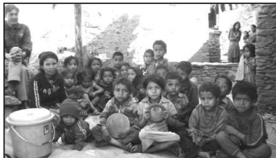
Participants of child care center at Daud