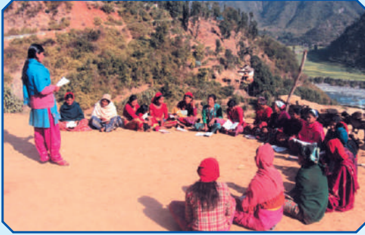
अनौपचारिक कक्षा संचालन