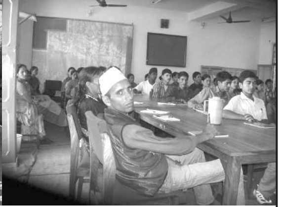
कर्मचारीका रूपमा तालिममा संलग्न