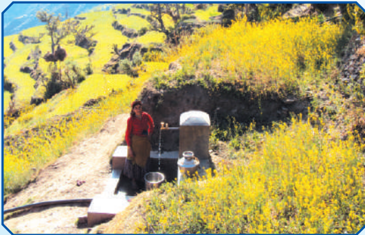
दलित समुदायमा स्वामेपानी