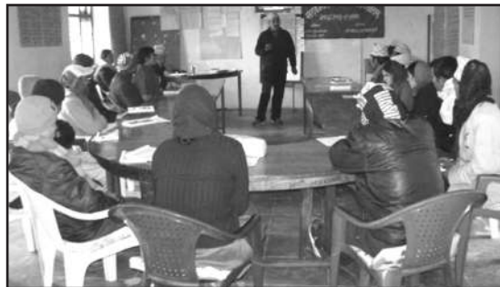
Participants during cooperative management training at Silgadi