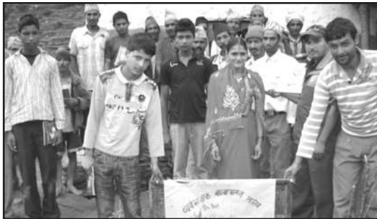
Participants of Goat farming training at Daud