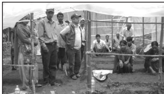
Participants of LRP development training at Silgadi