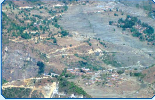
ग्रामीण पहुँच कार्यक्रम अर्न्तगत डौड तोलेनी सडकखण्ड