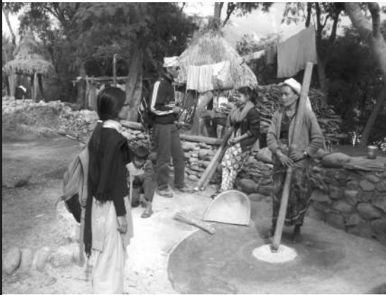
समुदायमा गई घरदैलो भेटघाट गरीरहेको