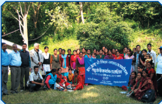
एच.आई.भी. साक्षरता कक्षा सहजकर्ता तालिम