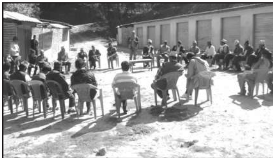
Participants during exposure Visit at Dadeldhura