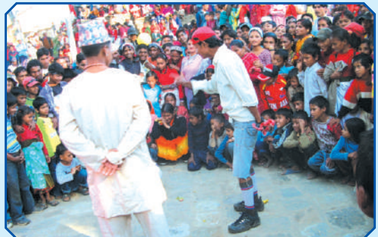
जनचेतनामूलक सडक नाटक