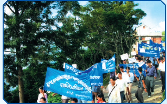
मानव अधिकार स्थापनाका लागि शान्ति न्याली