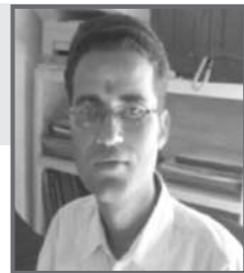
तिर्थराज भद्र कार्यक्रम संयोजक