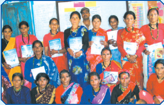
अग्रवा महिलाहरूका लागि पैरवी तालिम