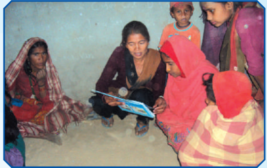
कामको रोजीमा भारत गएका कामदारका पविका सदस्यहरुलाई एच.आई.भी.को संक्रमण तथा जोरिमको जानकारी दिँदै