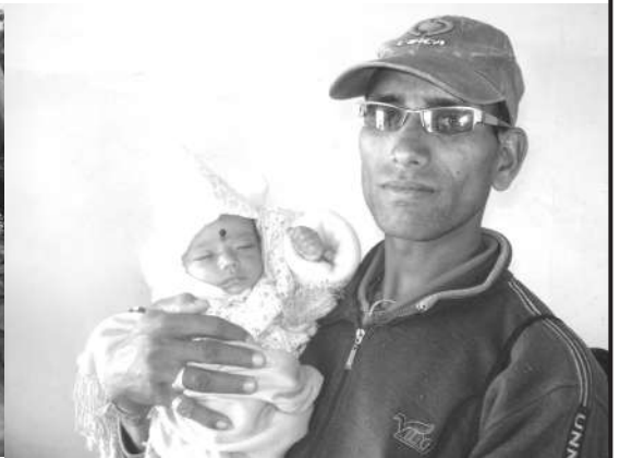
PMTCT प्रविधिबाट संक्रमित नभएकी छोरीका साथमा