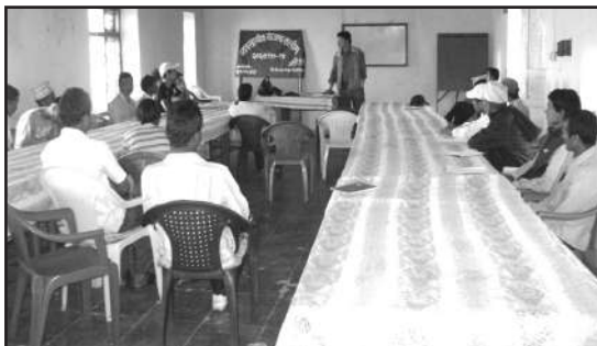
Participants of entrepreneurship development training at Silgadi