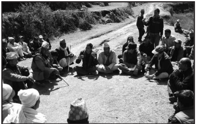
पिडित र समुदायका व्यक्तिहरूसँग छलफलमा संलग्न RAP केन्द्रिय टोली