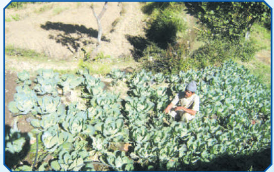
समुदायमा तरकारी सेती