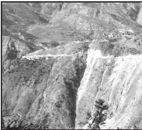
सडक कामदारहरूको मृत्यु र घाईते भएको स्थान