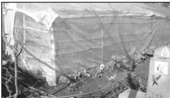
Tomato production inside plastic house together with micro-irrigation