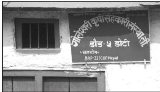
Office of the Goleshwori cooperative at Daud