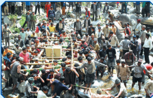
ग्रामीण उर्जा विकास कार्यक्रम अर्न्तगत जेनेरेटर ढुवानीका लागी सामुदायिक परिचालन