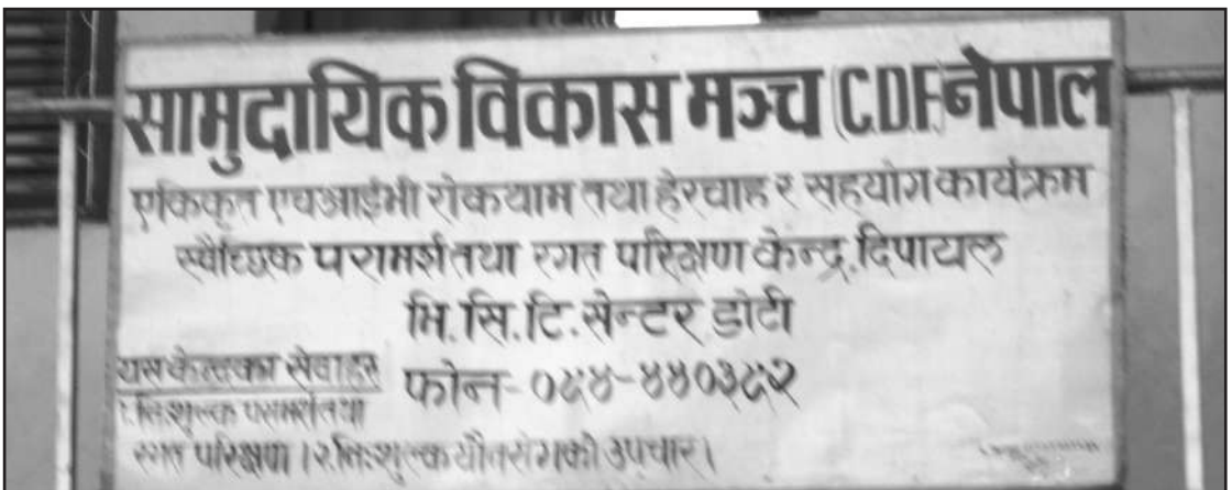
दिपायल स्थित स्वेच्छिक परामर्श तथा रगत परिक्षण केन्द्र