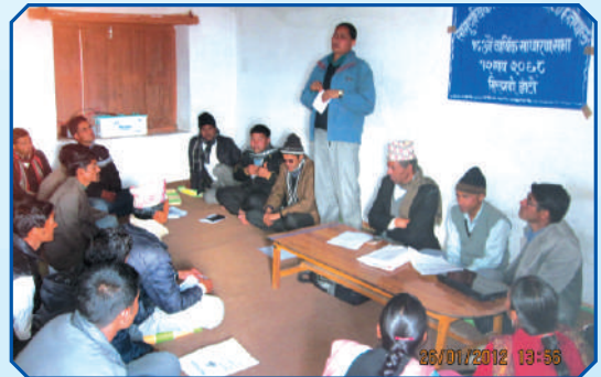
वार्षिक साधारणसभामा छलफल