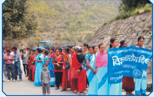
विश्व क्षयरोग दिवस २०६९