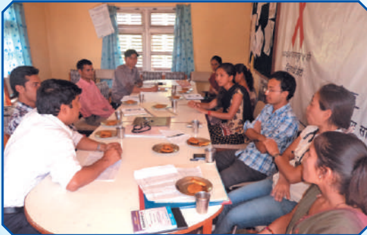
एच.आई.भी. एड्स कार्यक्रम अर्न्तगत जिल्ला अस्पताल डोटी एआरटी कमिटी संगको बैठकमा