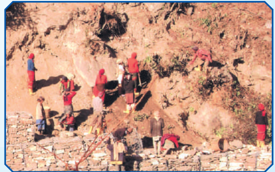
सडक निर्माणमा संलग्न समुदाय